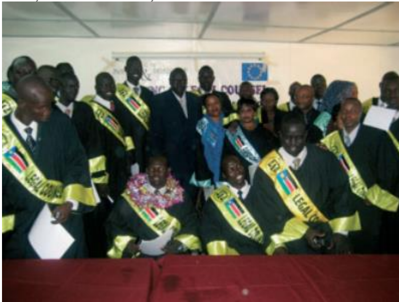
Promotion 2008 des juges formés au Sud-Soudan

Un des enjeux porté par RCN Justice & Démocratie était d'améliorer les compétences en notions élémentaires de droit du personnel du Ministère de la Justice ( Ministry of Legal Affairs and Constitutionnal Development ) et du Judiciaire ( Judiciary of Southern Sudan ).