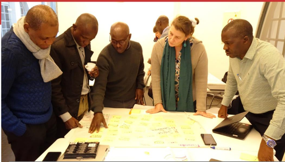
Semaine stratégique novembre '23 Atelier avec les membres de l'OA & nos équipes terrain